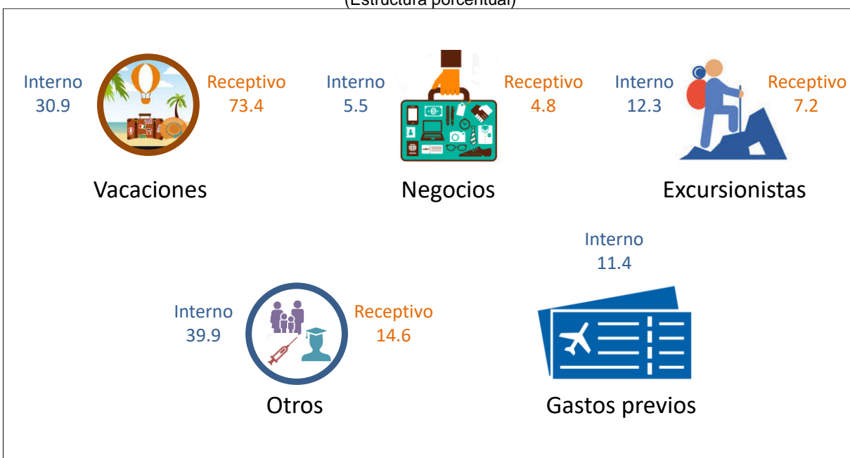
Gráfica 2 CONSUMO TURÍSTICO INTERIOR POR MOTIVOS DE VIAJE, 2019 (Estructura porcentual)

Nota: La suma de los valores puede no coincidir con el total debido al redondeo.