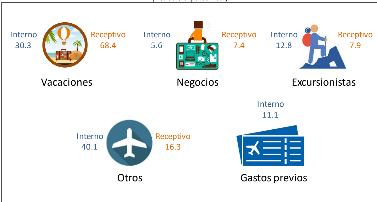
Gráfica 2 CONSUMO TURÍSTICO INTERIOR POR MOTIVOS DE VIAJE, 2017 (Estructura porcentual)

Nota: La suma de los valores puede no coincidir con el total debido al redondeo.