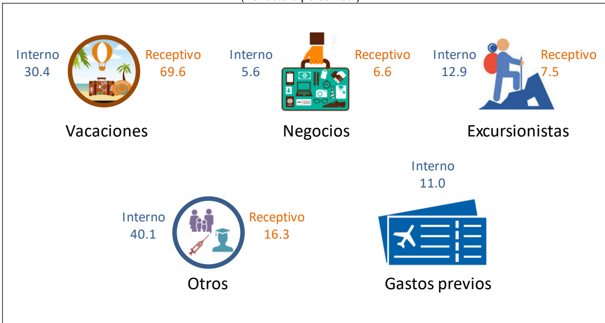
Gráfica 2 CONSUMO TURÍSTICO INTERIOR POR MOTIVOS DE VIAJE, 2018 (Estructura porcentual)

Nota: La suma de los valores puede no coincidir con el total debido al redondeo.